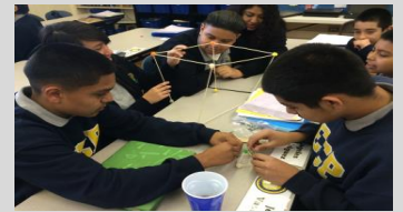
ECPistas de la clase 2021 muestran determinación y entusiasmo trabajando juntos durante Advisory