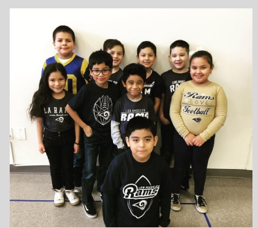
ECPistas demonstrating their sports pride during a LA Rams day.