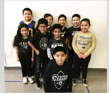
ECPistas demostrando su orgullo deportivo durante el día de los LA Rams.