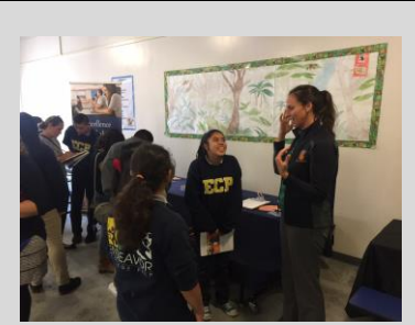
8 th grade ECPistas explore their options during our annual High School Fair