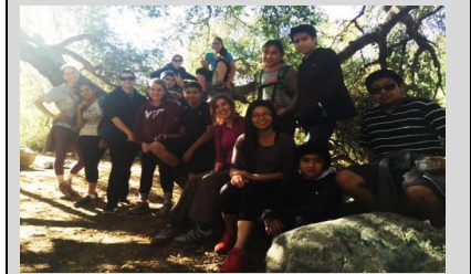
ECPistas conquistan Eaton Canyon en una excursión de grupo pequeño.

Endeavor College Preparatory Charter School prepara a nuestros estudiantes con las habilidades académicas, el carácter y la disciplina intelectual para que sobresalgan como líderes en la preparatoria, la Universidad y en su comunidad.