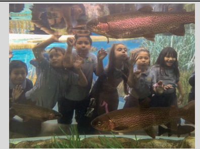
Ecpistas del segundo grado en su paseo al Acuario.