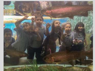
Second grade Ecpistas on their field trip to the Aquarium.