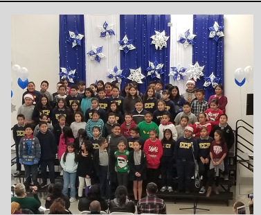
ECPistas performing for their families at the Winter Performance.