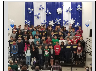
ECPistas cantando para sus familias en las Presentación de Invierno.