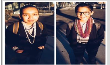
Epistas show off their excessive accessories during FUNbruary