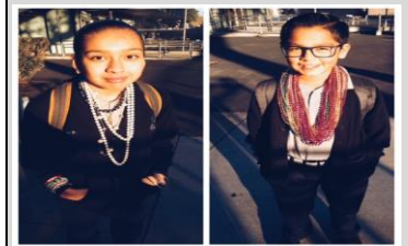
Ecristas muestran sus accesorios excesivos durante FUNbruary