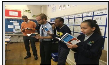
Maestros y estudiantes de ECP participan en una lectura en voz alta de Julius Caesar durante el día de Lectura a través de América