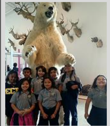
Third grade scholars from the Oxy homeroom show off their smiles while on a fieldtrip at the Natural History Museum

Endeavor College Preparatory Charter School prepares our students with the academic skills, character traits, and intellectual discipline to excel as leaders in high school, college, and their community.