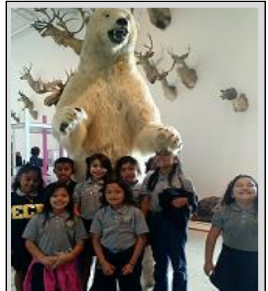
Estudiantes de tercer grado del salón de Oxy presumen sus sonrisas durante una excursión al Museo de Historia Natural