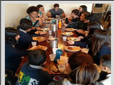
ECPistas who won the Pie Day Challenge enjoy some pie with staff at the Pie Hole