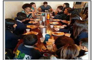
ECPistas que ganaron el reto de Pi Day disfrutaron de pasteles con nuestro personal en el Pie Hole

Nombre de estudiante: _____ Firma de padre: _____