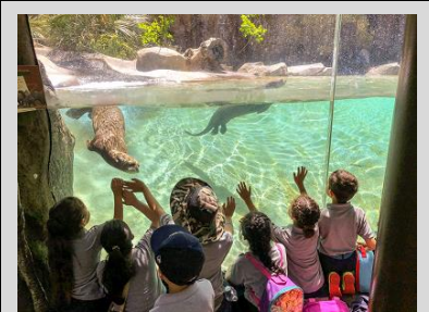
Estudiantes de Kinder en el Zoológico de Los Ángeles.