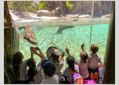
Kindergarten scholars on a fieldtrip to the Los Angeles Zoo.

Endeavor College Preparatory Charter School prepares our students with the academic skills, character traits, and intellectual discipline to excel as leaders in high school, college, and their community.