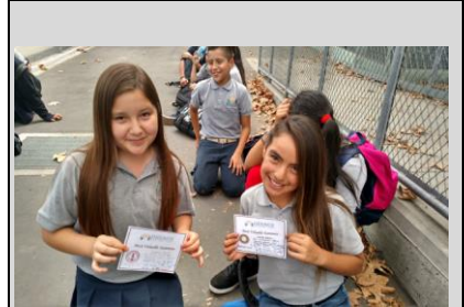
Estudiantes de la clase 2021 muestran su entusiasmo en obtener certificados de MVT para la semana.

Endeavor College Preparatory Charter School prepara a nuestros estudiantes con las habilidades académicas, el carácter y la disciplina intelectual para que sobresalgan como líderes en la preparatoria, la Universidad y en su comunidad.