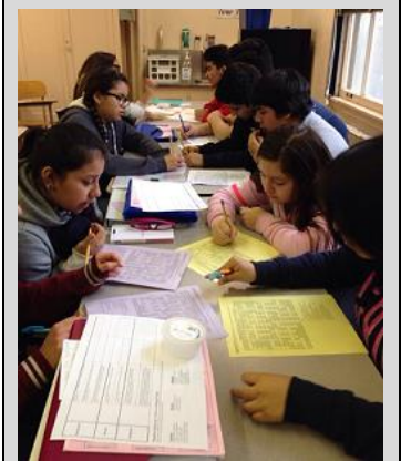
El salón de Kentucky del octavo grado trabajando duro durante la clase de lectura