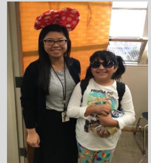
Ms. Mak and an ECPista show school spirit during Spirit Week

Student Name: _____ Parent Signature: _____