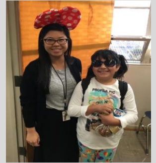
La Srta. Mak y un ECPista muestran su espíritu escolar durante la Semana de Espíritu