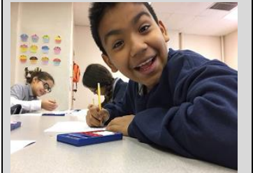
Un ECPista de 7º grado muestra entusiasmo durante los grupos de matemáticas diferenciadas

Endeavor College Preparatory Charter School prepara a nuestros estudiantes con las habilidades académicas, el carácter y la disciplina intelectual para que sobresalgan como líderes en la preparatoria, la universidad y en su comunidad.