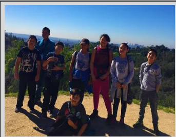
La Srta. Sussman, la Srta. Baggerly y la Srta. Harwood llevaron a ocho estudiantes del 4-6 grado en una caminata el sábado, donde subieron al sendero desde Fern Dell hasta Griffith Observatory.

Nombre del Estudiante: _____ Firma del Padre: _____