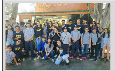
¡ECPistas del 8° grado en Knotts Berry Farm para el Día de Física!