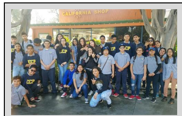
8th grade ECPistas at Knotts Berry Farm for Physics Day!

Endeavor College Preparatory Charter School prepares our students with the academic skills, character traits, and intellectual discipline to excel as leaders in high school, college, and their community.