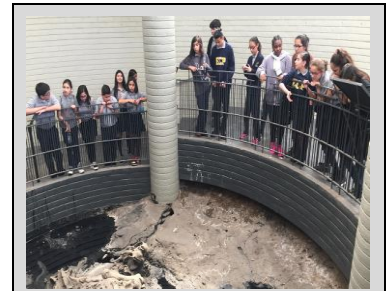
7 th grade scholars on a field trip to the La Brea Tar Pits

Student Name: _____ Parent Signature: _____