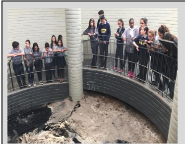
Estudiantes del séptimo grado en un paseo a La Brea Tar Pits