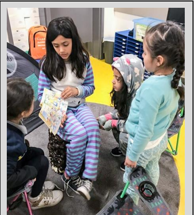
Una Ecpista lee para estudiantes más jóvenes en el Día de Pijama, en celebración del Día de Lectura a través de América.