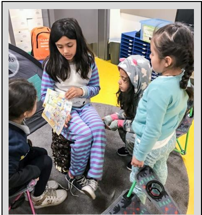
An Ecpista reading to younger scholars on Pajama Day, in celebration of Read Across America Day.