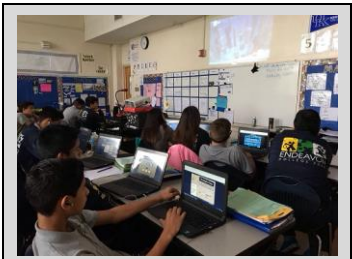
ECPistas independently working on their i-Ready lessons