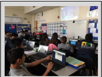
ECPistas trabajando independientemente en sus lecciones de i-Ready

Nombre del Estudiante: _____ Firma del Padre: _____