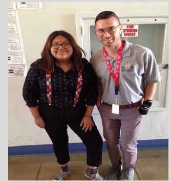
ECPistas y personal de ECP demostrando espíritu escolar