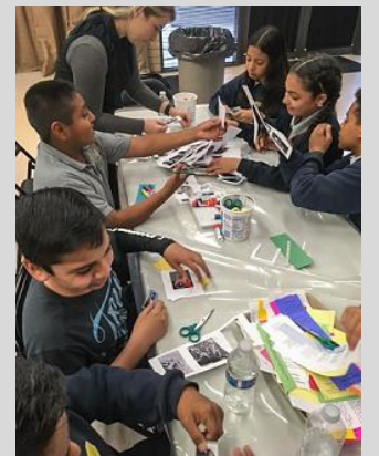
ECPistas de 6º grado visitan el Museo Afroamericano