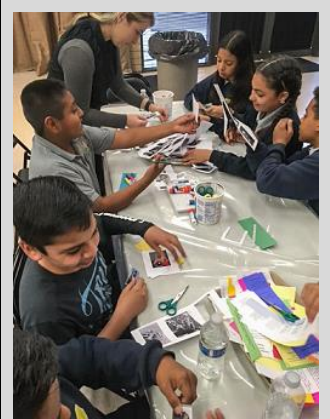
6 th grade ECPistas visit the African American Museum