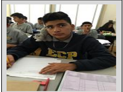
Un ECPista y Sir Shack unidos durante la clase de ciencias