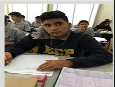
An ECPista and Sir Shack bond during science class