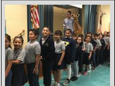
Fourth grade PRIDE champs pose with their mascot, Akili