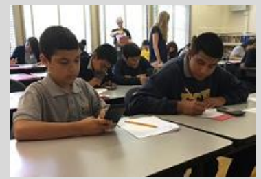
ECPistas en el salón de San Diego demuestran determinación durante la clase de matemáticas