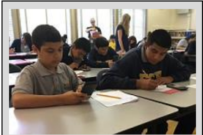
ECPistas in the San Diego homeroom show determination as they work independently on math work