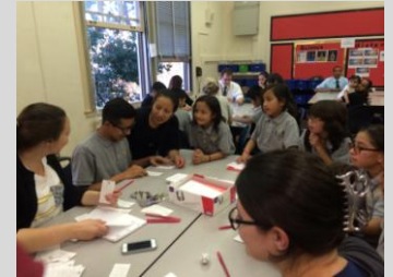
Parents, teachers, and scholars battle it out during Family Game Night at Albion