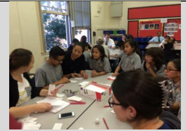
Padres, maestros, y estudiantes se enfrentan durante la Noche Familiar de Juegos en Albion

Además, me aseguraré de que mi hijo/a esté bien descansado/a y listo/a para aprender cada día.