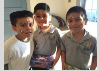
Ecpistas at Dena show off their stickers during FUNbruary