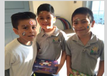
Ecpistas en Dena muestran sus calcomanías durante FUNbruary