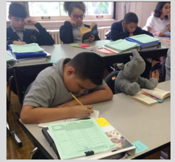
Estudiantes del 7 ° grado disfrutan de la compañía de Sir Shack

Endeavor College Preparatory Charter School prepara a nuestros estudiantes con las habilidades académicas, el carácter y la disciplina intelectual para que sobresalgan como líderes en la preparatoria, la Universidad y en su comunidad.