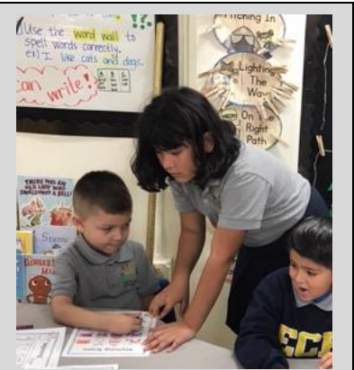
ECPIstas ayudando en salones.