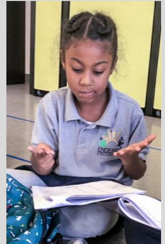
An ECPista demonstrating that every minute counts, including after school.