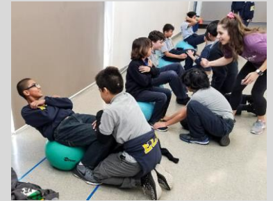
ECPistas haciendo ejercicio durante la clase de Aeróbicos.