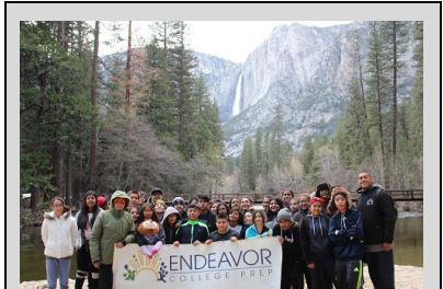
Nuestros alumnos de 8° grado demuestran el orgullo de ECP en Yosemite Falls.

Endeavor College Preparatory Charter School prepara a nuestros estudiantes con las habilidades académicas, el carácter y la disciplina intelectual para que sobresalgan como líderes en la preparatoria, la universidad y en su comunidad.