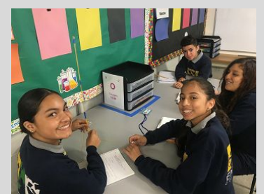
ECPISTAS working in the Science Lab.

Endeavor College Preparatory Charter School prepares our students with the academic skills, character traits, and intellectual discipline to excel as leaders in high school, college, and their community.