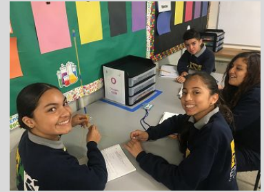
ECPistas trabajando en el Laboratorio de Ciecía.