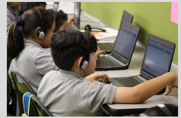
ECPistas showing determination during i-Ready testing.