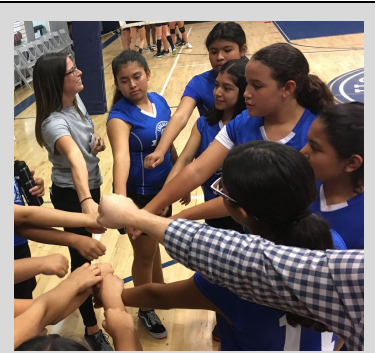
ECP Lady Lions huddling before a big match.