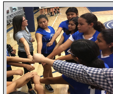
ECP Lady Lions preparándose ante un gran partido.