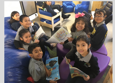
ECPistas excited to read in the Think Big bookroom.