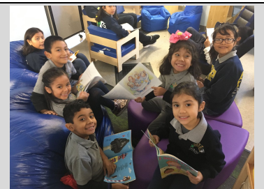
ECPistas entusiasmados de leer en el salón de libros, Think Big.