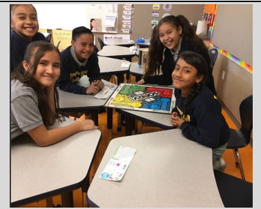
La clase de Boston gozando de su tiempo de Equipo y Familia.