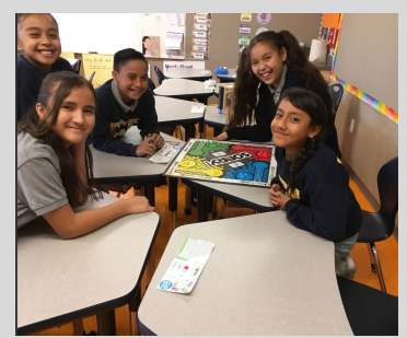
Boston University enjoying their Team & Family time.