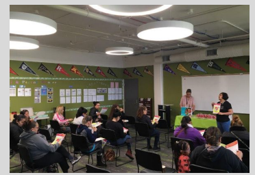
Families attending the first Parent Workshop of the year.