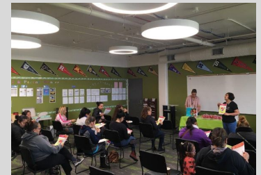
Familias asistiendo al primer Taller de Padres del año.