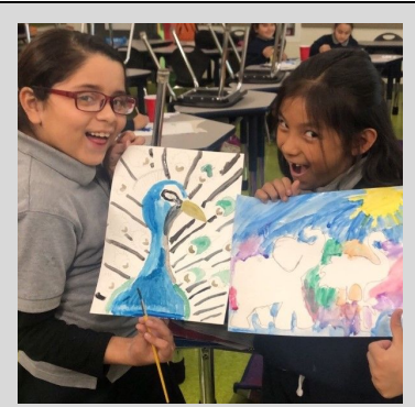
ECPistas in the Arts and Enrichment program working on watercolor paintings.