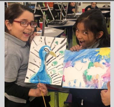
ECPistas en el programa de después de escuela usando pintura de acuarela.