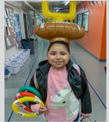
Esta estudiante está lista para el miércoles de locura!