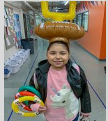
A young scholar ready for Wacky Wednesday.