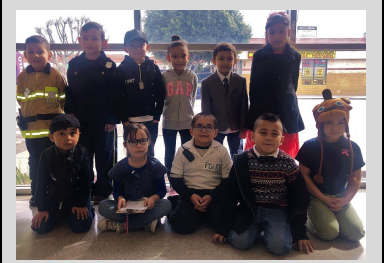
Estudiantes durante el Día de Profesionas del Futuro.