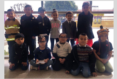
Scholars dressed for success on Future Career Day.