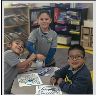
Kindergarten scholars working on their Rainbow Fish paintings.