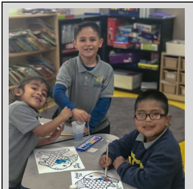
Estudiantes de Kinder trabajando en sus pinturas del Pez Arco Iris.