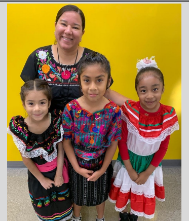
Personal y estudiantes celebrando el Mes de Herencia Cultural.