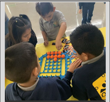
Scholars participating in October's Merit Bash!