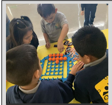
Estudiantes participando en la Celebración de Mérito de octubre.