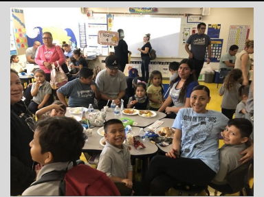
¡Familias participando en la primera Noche Familiar del año!