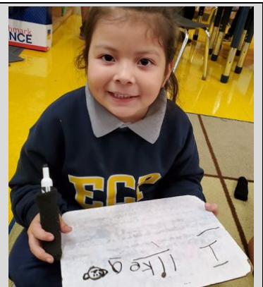
Kindergarten scholars practicing their writing skills.