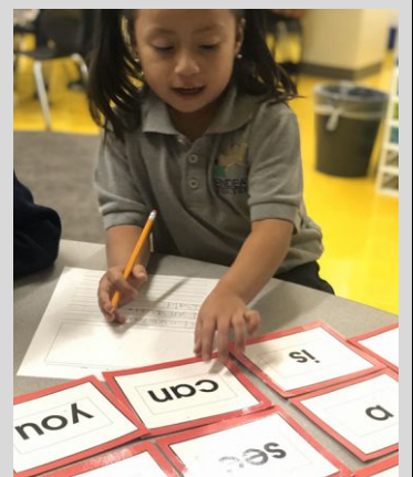
Kinder scholars working on sight word recognition!