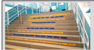
¡Nuestras escaleras están listas para la Semana de la Bondad!