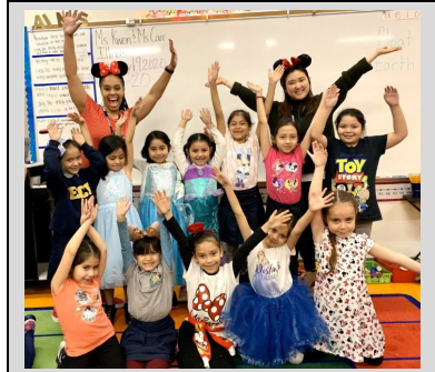
Estudiantes del primer grado disfrutando del Día de Disney!

Endeavor College Preparatory Charter School prepara a nuestros estudiantes con las habilidades académicas, el carácter y la disciplina intelectual para que sobresalgan como líderes en la preparatoria, la universidad y en su comunidad.