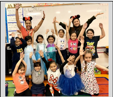
First grade scholars enjoying Disney Day!

Endeavor College Preparatory Charter School prepares our students with the academic skills, character traits, and intellectual discipline to excel as leaders in high school, college, and their community.